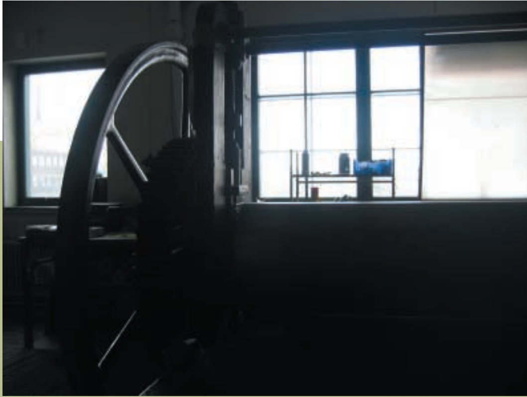
Text och foto: Magdolna Szabó