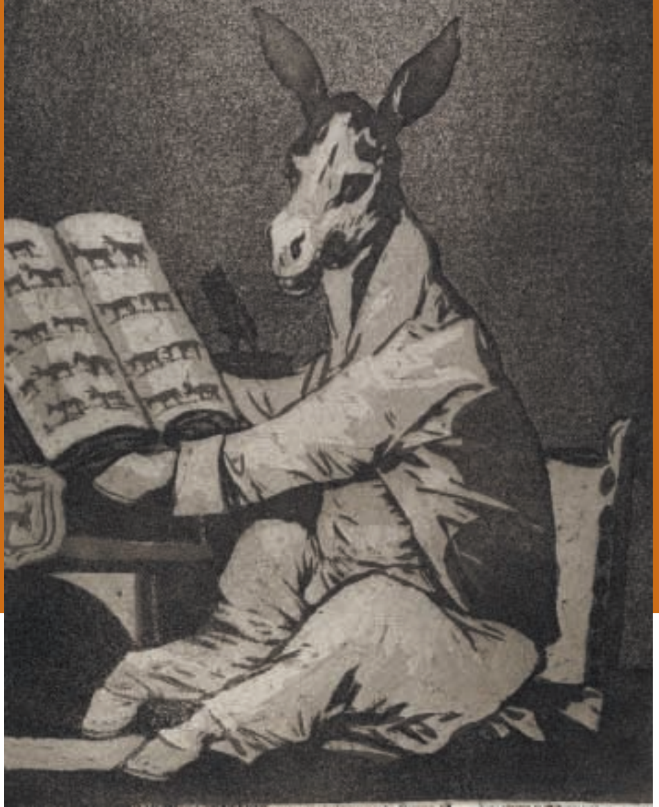
och sådan var hans farfar. Francisco Goya y Lucientes, 1790.